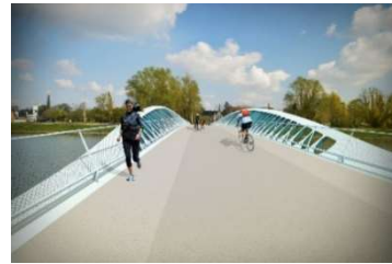
Toekomstbeelden brug Watersportbaan – Annie Vande Wielebrug – Ney & Partners, Omgeving