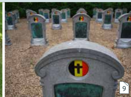
As bewaren in een keramische sierurne in een urnentuin