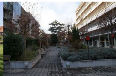
jonge starters en WZC (Marien Haus, Basel)

En heel wat ontwijde kerken worden ingezet als gemeenschapsruimte. Dit zou ook mogelijk zijn voor de Sint-Martinuskerk.