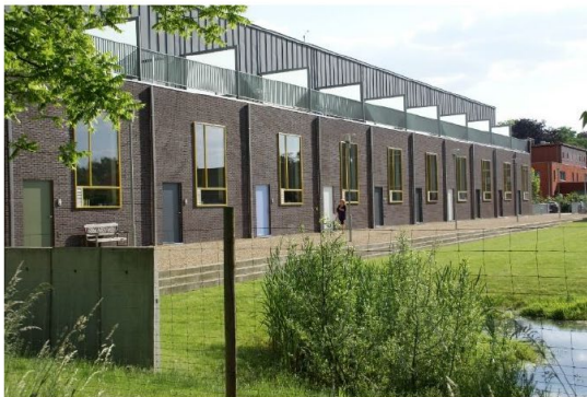
project Wonewei in Lovenjoel: compacte rijwoningen

Er is voor dit soort projecten een zorgvuldige en gedetailleerde stedenbouwkundige studie nodig: om een geschikte architecturale vorm te vinden, om het woonuitbreidingsgebied te verweven met bestaande bebouwing en de nog in te vullen woonpercelen aan de randzone en om de nodige zorg te besteden aan de publieke ruimte en aangename voetgangersverbindingen.