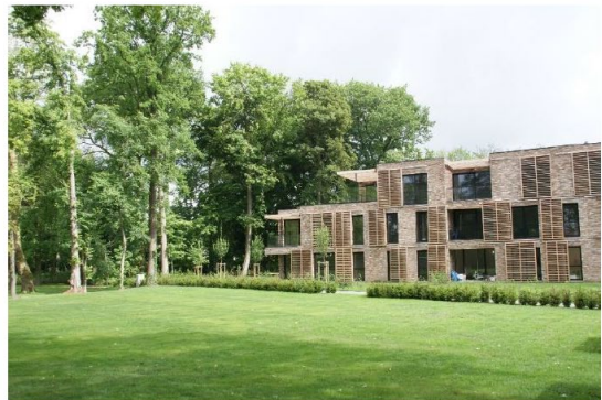
project Viteux in de Pinte: levenslang wonen in een kasteelpark