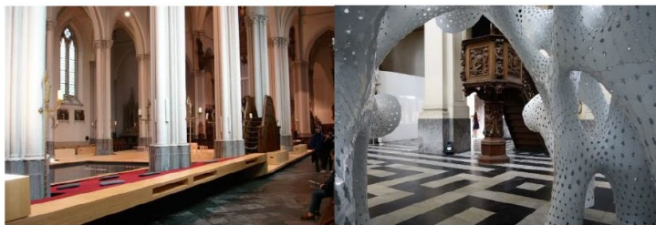
kerk als gemeenschapsruimte (Brugge)

En heel wat ontwijde kerken worden ingezet als gemeenschapsruimte. Dit zou ook mogelijk zijn voor de Sint-Martinuskerk.