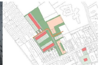
WZC + WUG Leiehome, een sociale zorgcluster?