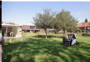
gedeelde tuin (de Klinkaard, Boom)