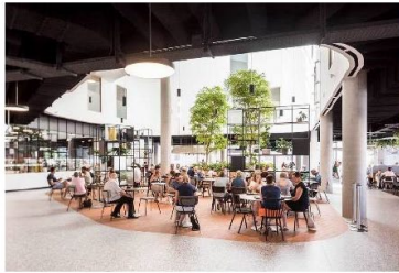
gedeeld restaurant (Buda kitchen, Kortrijk)

Op veel plaatsen in Vlaanderen worden voorzieningen geopend voor de omwonenden: het restaurant van het WZC Budalys in Kortrijk, de tuin van de Klinkaard in Boom. Ook een voorbeeld in Basel is inspirerend voor het WZC en het vergunde WUG Leiehome: jonge starters krijgen huurkorting als ze vrijwilligerswerk doen in het centrum.